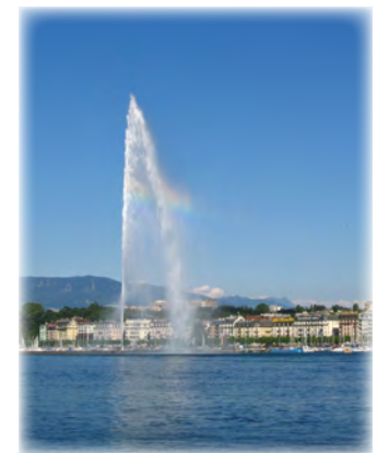
Notre 1 er bureau est situé au N° 6 du Quai Gustave Ador à Genève.

Dès sa création, Notre SOCIÉTÉ est active dans tous les domaines graphiques traditionnels.